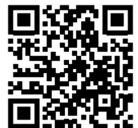
Video IDEA 9